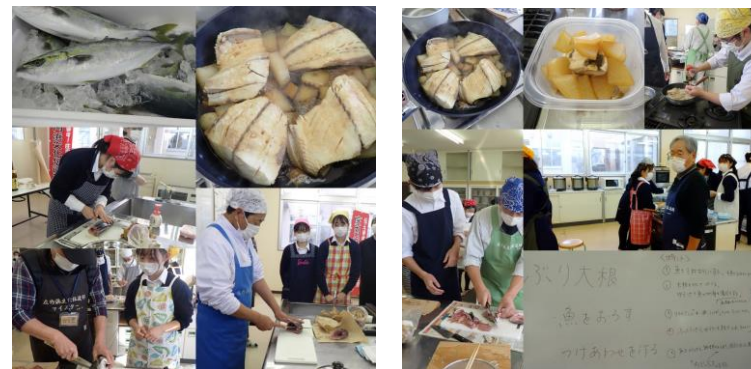
R3. 12. 7～14 県立酒田東高校 家庭科調理実習